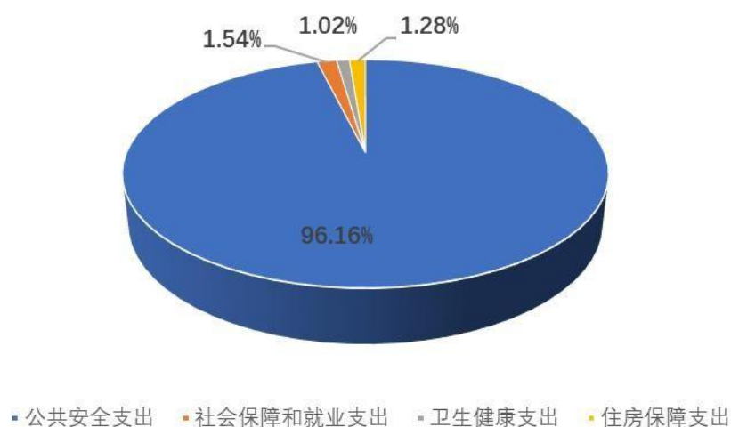
图四：财政拨款支出决算结构（按功能分类）

2019 年度财政拨款支出 4815.67 万元，主要用于以下方面：公共安全支出 4630.93 万元，占 96.16%；社会保障和就业支出 74.29 万元，占 1.54%；卫生健康支出 49.01 万元，占 1.02%；住房保障支出 61.44 万元，占 1.28%。