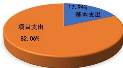
图一：支出构成情况（按支出性质）

本部门 2019 年度本年支出合计 4815.67 万元，其中：基本支出 864.09 万元，占 17.94%；项目支出 3951.58 万元，占 82.06%；经营支出 0 万元，占 0%。如图所示：